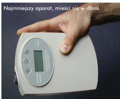
Aparat nCPAP (waga 750 g) do terapii bezdechu sennego

Aparat Minni Max do terapii bezdechu sennego z dołączonym nawilżaczem