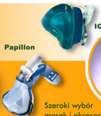
Szeroki wybór masek i akcesoriów.